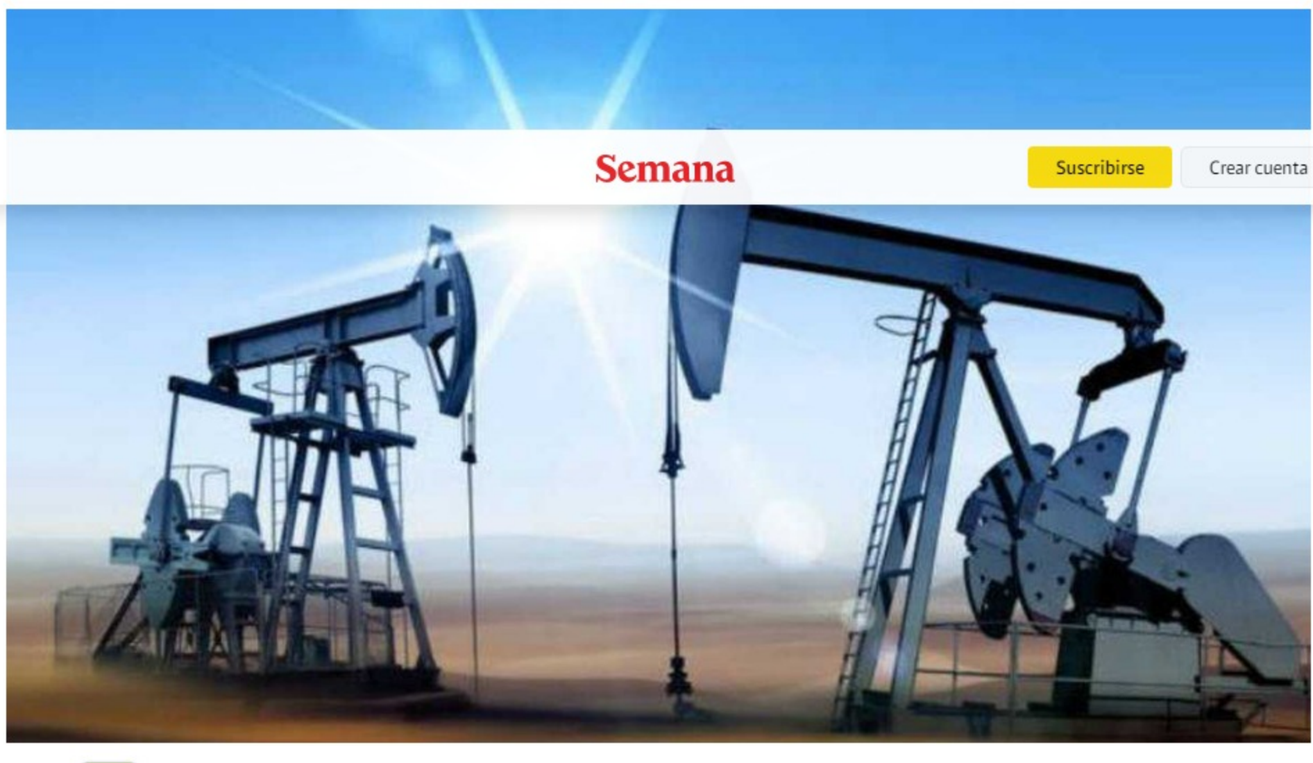
El barril de petróleo superó los $81 dólares por barril esta semana.

El 2021 ha sido un año marcado por la recuperación de los precios del petróleo, los cuales se vieron afectados en 2020 por la pandemia del coronavirus, llegando, incluso, a alcanzar mínimos históricos.