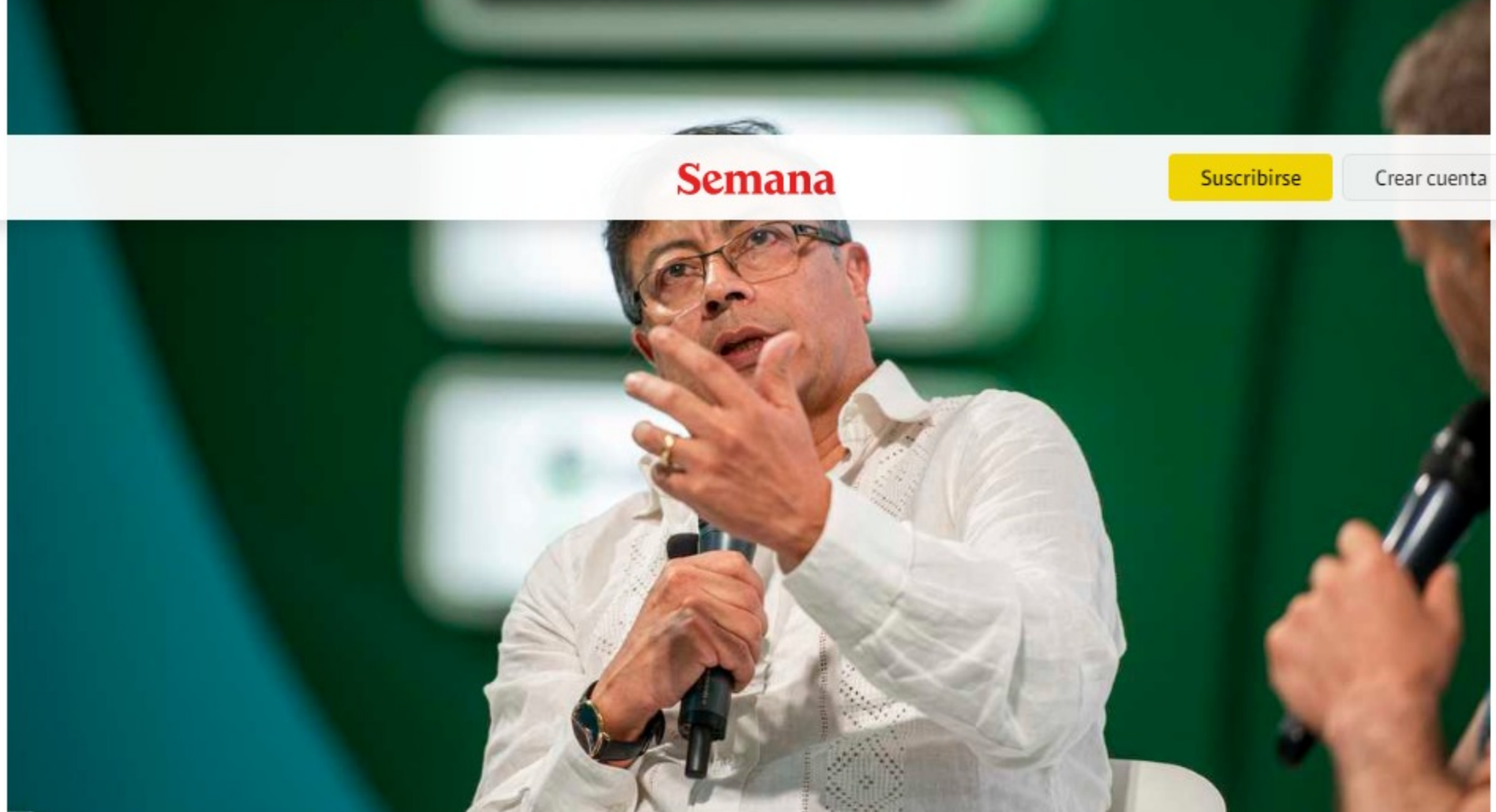
Gustavo Petro en el Congreso Nacional de Minería

Durante su intervención en el Congreso Nacional de Minería, el senador y candidato presidencial Gustavo Petro dijo este jueves que el país debe realizar un cambio en su política minero-energética.