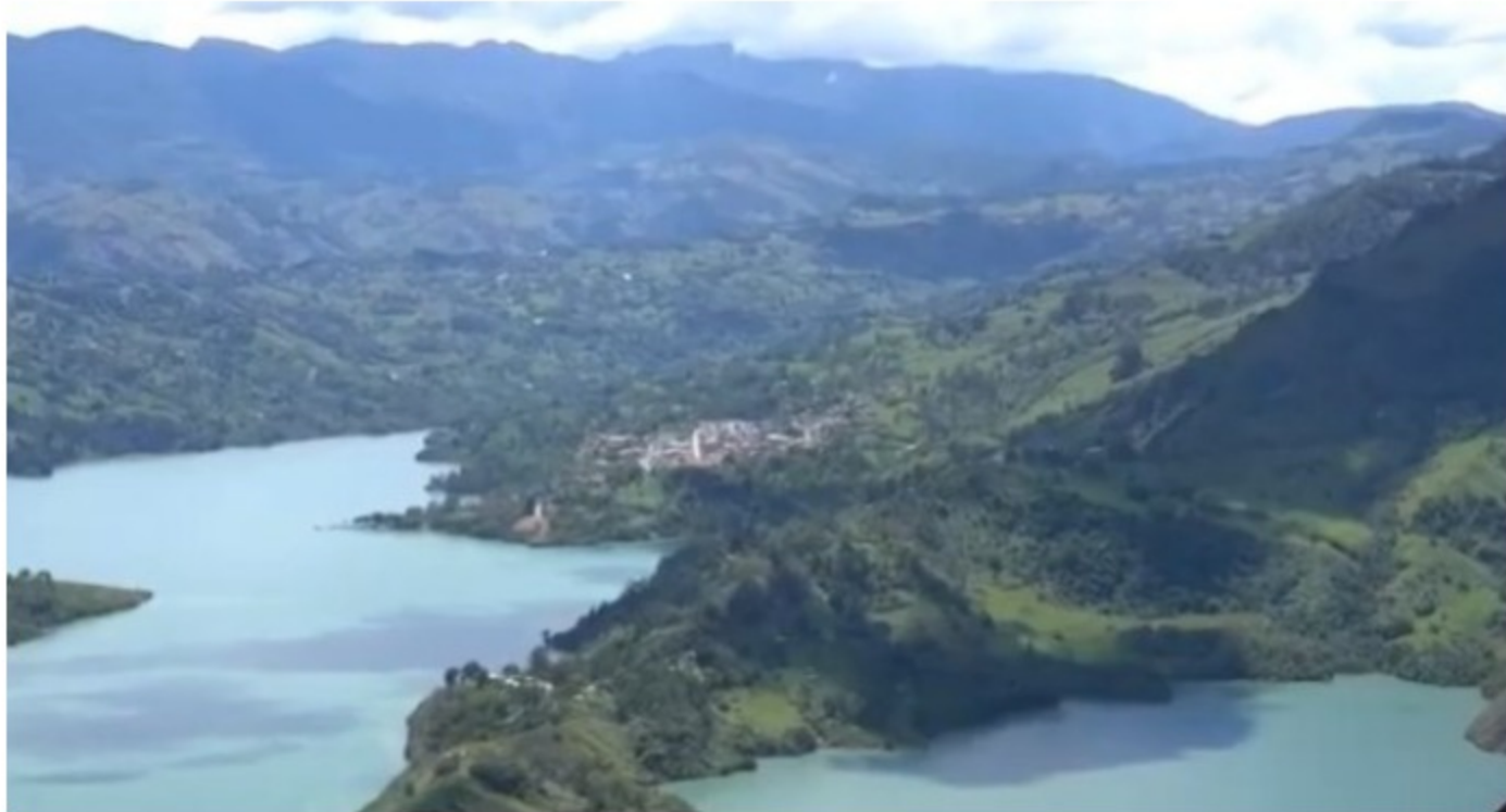
Denuncian proyecto de perforación que afectaría al Embalse del Guavio

En Ubalá, Cundinamarca, cientos de familias denuncian un proyecto de perforación de aproximadamente 20 pozos petrolíferos que causarían daño al Embalse del Guavio que surte de agua al 30 % de los habitantes de Bogotá . Aseguran que las fuentes hídricas de la cordillera oriental colombiana están en riesgo.