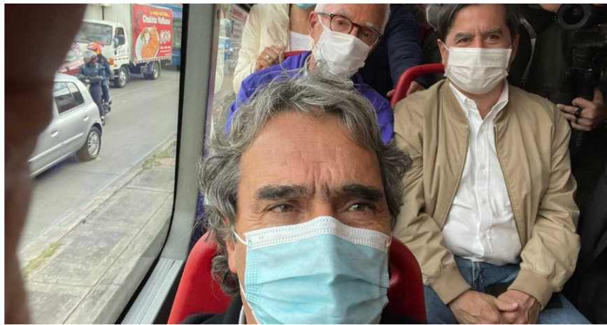
La Coalición de la Esperanza en TransMilenio