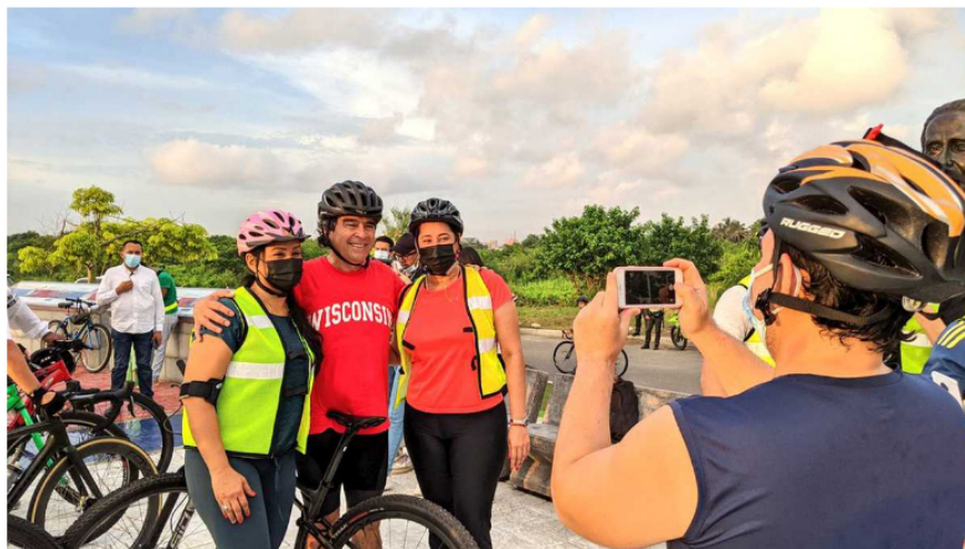
Sergio Fajardo en campaña en Barranquilla

En Ibagué, Villavicencio y Barranquilla el escenario fue igual, pese a que estuvieron en las plazas de mercado y algunos montaron en bicicleta. En el malecón de la capital del Atlántico, Fajardo pedaleó en una de sus giras y despertó la críticas de Armando Benedetti, fiel seguidor de Petro. “Parecen un par de adolescentes en un campo de verano, vienen a Barranquilla a montar bicicleta, en el norte, a caminatas sobre el malecón y parchan con los jóvenes en la misma zona. Son programas de verano de los dos, en los estratos 5 y 6, y en una soledad increíble”, le dijo Benedetti a SEMANA.