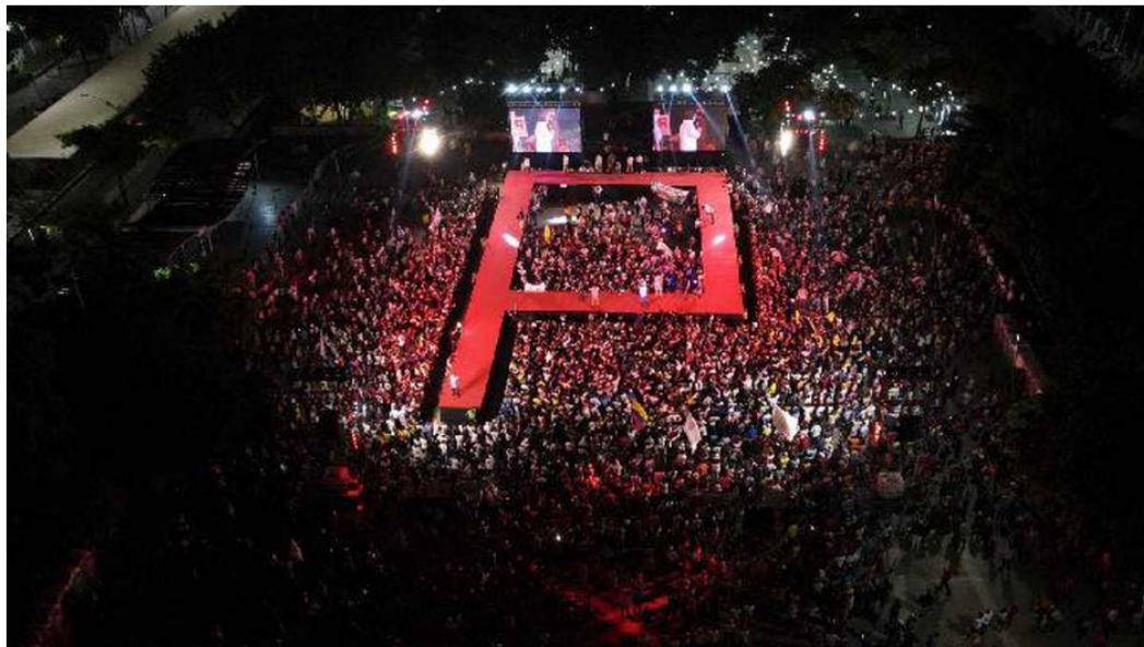
La tarima del senador Gustavo Petro en Barranquilla

Las imágenes de Sergio Fajardo, Juan Fernando Cristo, Juan Manuel Galán y Jorge Enrique Robledo, montados en TransMilenio, confirmaron que algunos políticos solo usan el sistema cuando buscan votos. Al tiempo, ratificaron que la campaña presidencial de 2022 ya arrancó y sus protagonistas parecen no temerle a la pandemia. En calles, plazas y buses pululan políticos. Algunos escenarios, como los de Gustavo Petro, han lucido atiborrados de gente. Otros, como los de la Coalición de la Esperanza, se ven escuálidos, con escasos seguidores.