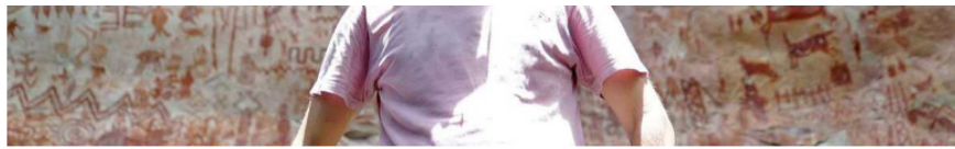
Alejandro Gaviria, recorrió varios departamentos para revisar la deforestación en el país.

La pandemia por el covid-19 no ha limitado los viajes de los precandidatos presidenciales. Gaviria, por ejemplo, recorrió recientemente Chiribiquete y Cerro Azul, en Guaviare, uno de los destinos selváticos que más le apasionan y que hacen parte, según confesó, del logotipo de su campaña. La estrategia con los recorridos es que el rostro del académico sea conocido más allá de Bogotá y Medellín.