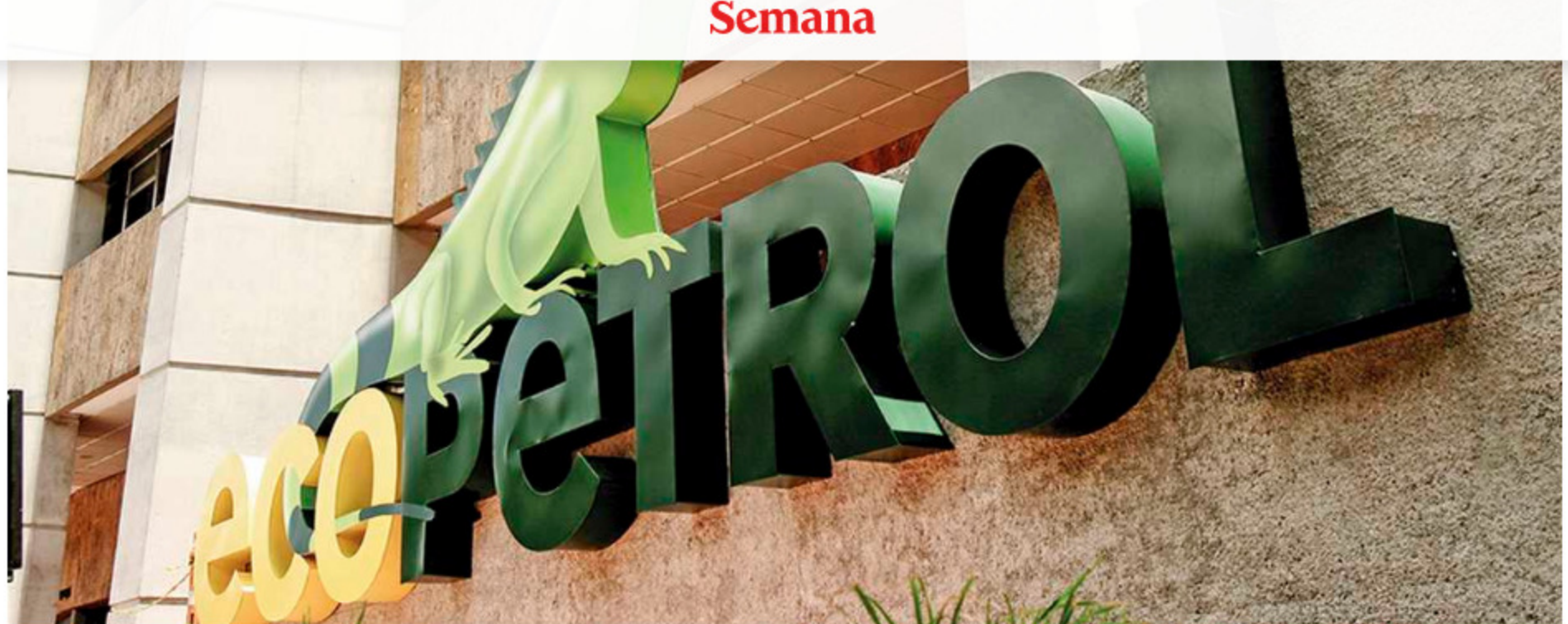
Con la compra de ISA, Ecopetrol pretende acelerar su proceso de transición energética.

Ecopetrol informó este viernes que la Superintendencia Financiera de Colombia autorizó el programa de emisión de acciones de la petrolera.