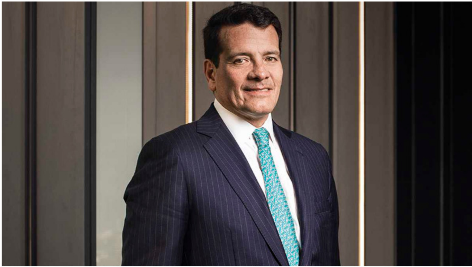
*Aplicamos soluciones digitales para resolver problemáticas de la empresa, optimizar modelos operativos y fortalecer el talento humano”: Felipe Bayón, presidente de Ecopetrol.

“Al hacer una emisión hasta lo que está permitido por ley, se conserva el 80 % de participación pública en la empresa y se aumenta al 20 % la participación de los privados”, explicó Bayón en su momento.