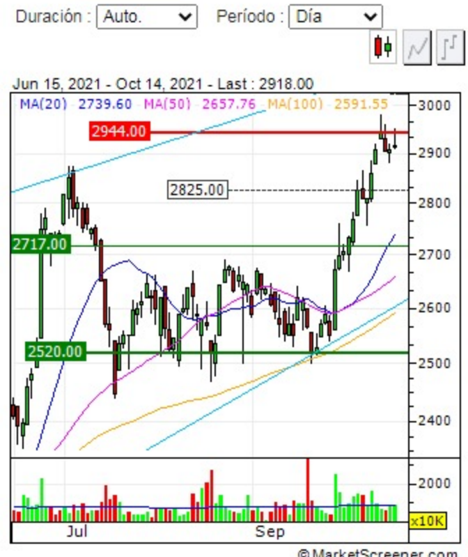
Gráfico ECOPETROL SA