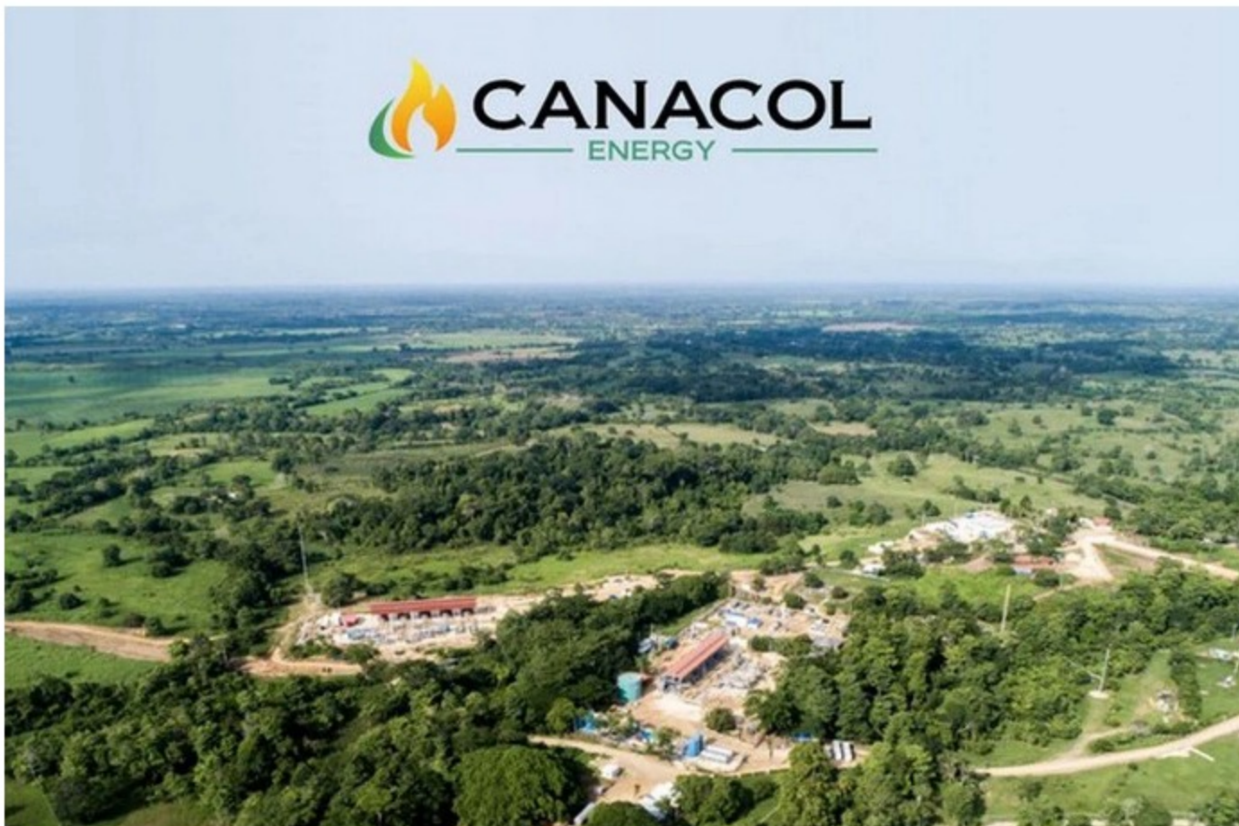
Canacol Energy, campo de gas y petróleo.

La Agencia Nacional de Hidrocarburos de Colombia (ANH) reveló el nombre de una nueva empresa que quedó habilitada para participar en el nuevo ciclo de la Ronda Colombia 2021: se trata de Canacol Energy .