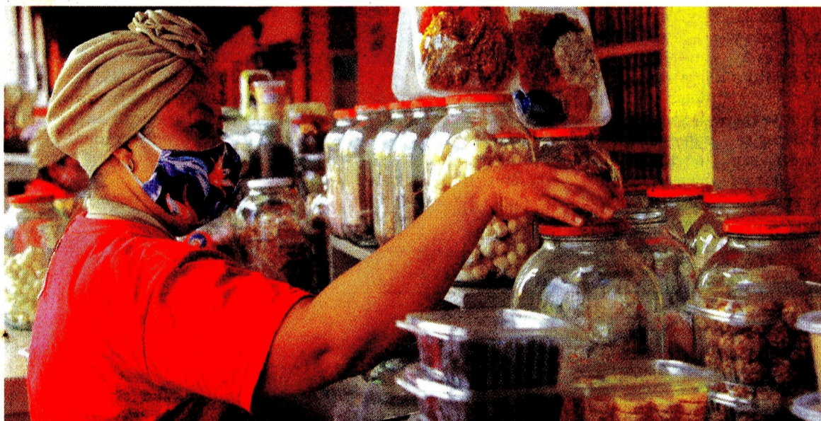
Comercio y los servicios de comida, otros de los sectores que apoyaron la recuperación de estos trabajos.

Empresas como Casalimpia, Teleperformance y Hoteles Radisson se han beneficiado con la reapertura y han impulsado la contratación de mujeres dentro de su personal en los últimos meses. Pág. 6