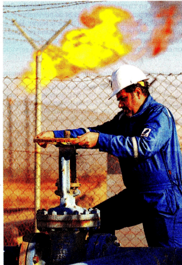
US$ 1.688 millones van a transporte y distribución.

titividad del país y traer desarrollo a todas las regiones de una forma sostenible. Hemos alcanzado grandes logros en los últimos 20 años, pasamos de tener 1,9 millones de usuarios a lograr más de 10.446.000, lo que equivale a una penetración de casi el 80% y nos hace un referente mundial; espacios de diálogo como los de este congreso nos permiten seguir fortaleciendo esta industria tan prometedora”, indicó Murgas.