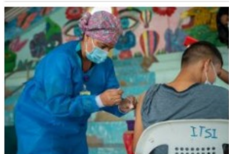
Más de 11.000 niños se han vacunado contra el Covid en Barrancabermeja