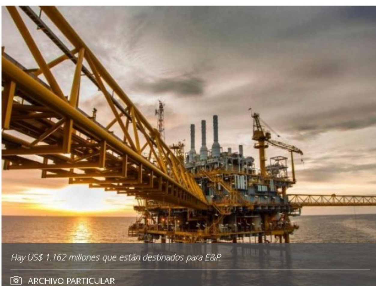
Hay US$ 1.162 millones que están destinados para E&P