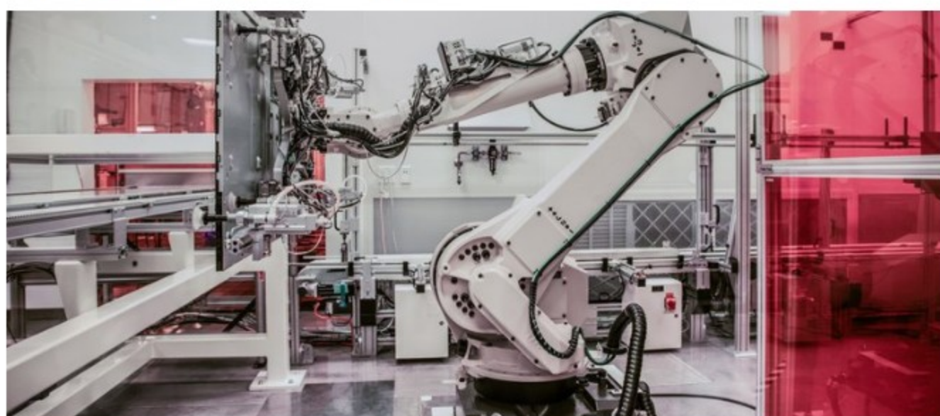
01/10/2018 Robot en una fábrica. Industria 4.0 POLÍTICA INVESTIGACIÓN Y TECNOLOGÍA MICROSOFT

Se le concibe a la industria 4.0 como la etapa técnico-económica en la que se encuentra la humanidad, cuyo elemento principal de transformación se enmarca en la inteligencia artificial, así como en la acumulación creciente de grandes cantidades de datos y otras prácticas que vienen desarrollándose en las últimas décadas como el uso de algoritmos para procesarlos y la interconexión masiva de sistemas y dispositivos digitales.