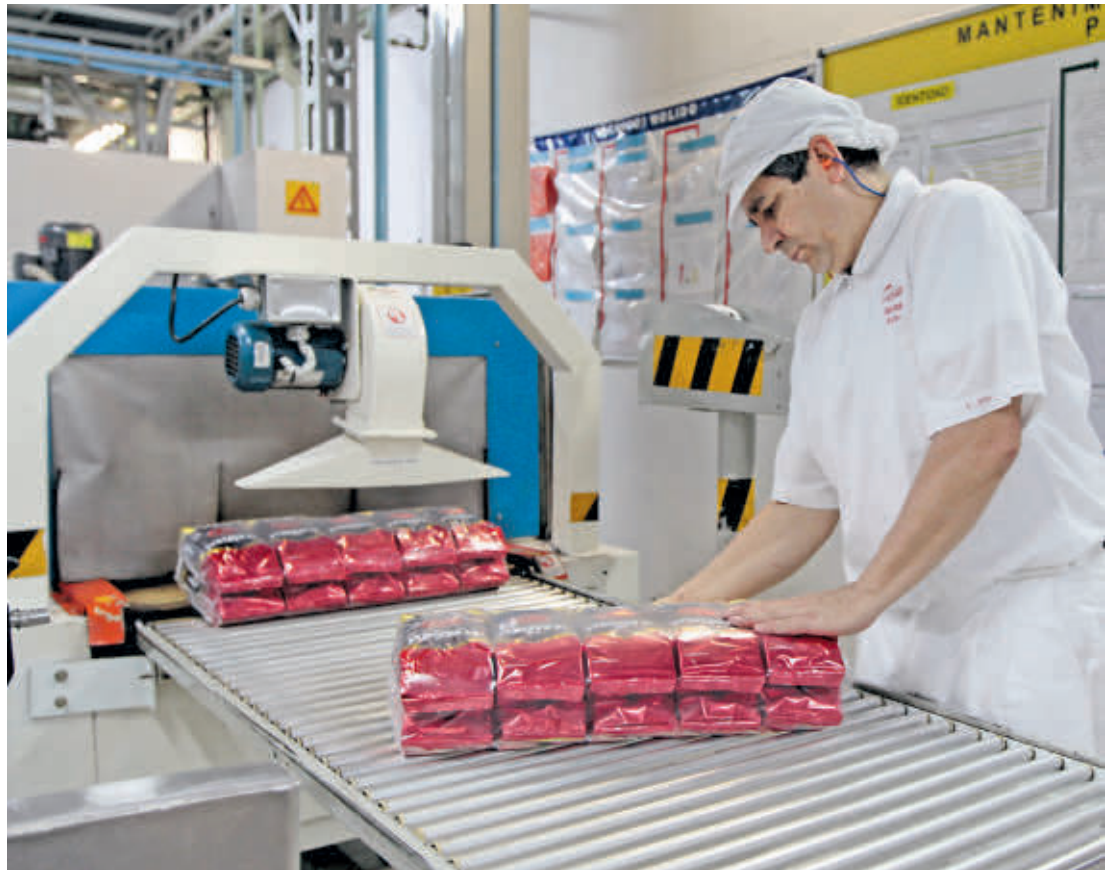
De acuerdo con el más reciente reporte financiero de Nutresa, los activos ascendían a $15,82 billones con corte a septiembre.

Por su parte, la fracción de Grupo Sura, principal accionista de Nutresa, observó una apreciación del 0,56%. En las operaciones iniciales alcanzó los $21.900, por encima de los $21.440 con los que terminó el viernes, pero a lo largo del día