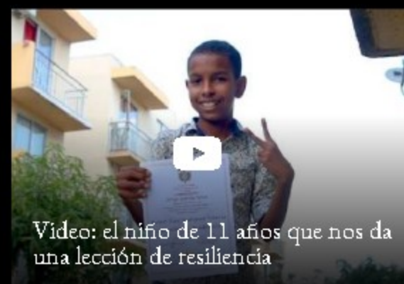
Vídeo: el niño de 11 años que nos da una lección de resiliencia