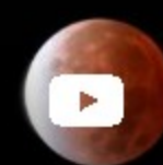
[En fotos] Así fue el eclipse lunar parcial más largo en 580 años