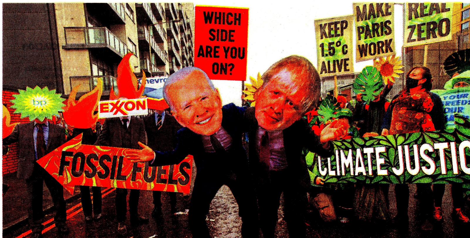
Países desarrollados se comprometieron a duplicar los recursos destinados a los mercados emergentes para la adaptación al cambio climático.