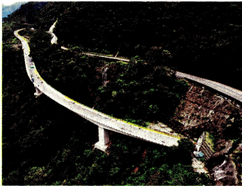
El nuevo viaducto de Macallito está ubicado en la unidad funcional 2 y tiene una longitud de 962 metros, que lo convierte en el más largo del proyecto.

De acuerdo con la entidad, este viaducto cuenta con elementos de última tecnología, cumple con altos estándares de seguridad y presenta actualmente un avance en su ejecución del 99,86 por ciento, al tiempo que la inversión en esta obra es superior a los 186.405 millones de pesos y se es-