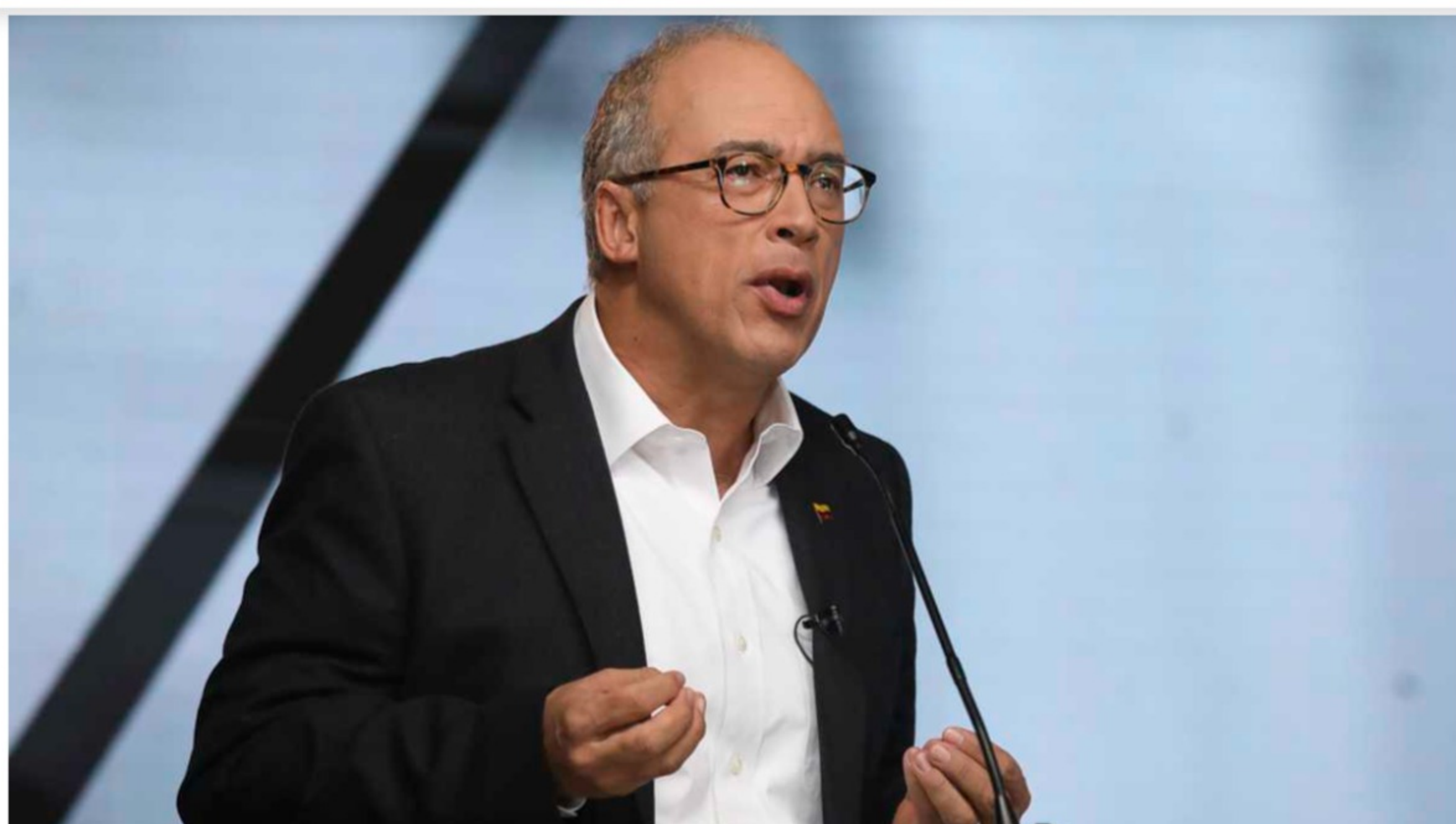
Juan Carlos Echeverry Garzón. Candidatos Presidenciales Independientes 2022. El Debate SEMANA.

En el segundo Debate SEMANA con los candidatos a las elecciones presidenciales Colombia 2022, el exgerente de Ecopetrol cuestionó a Hernández y lo invitó a informarse antes de asistir a debates presidenciales