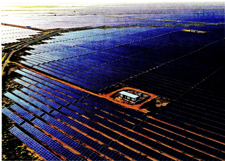
Paneles solares en el parque Bhadla, al norte de India. El país asiático busca convertirse en una potencia de energía limpia.

JULES KORTENHORST (*) - © PROJECT SYNDICATE - DENVER