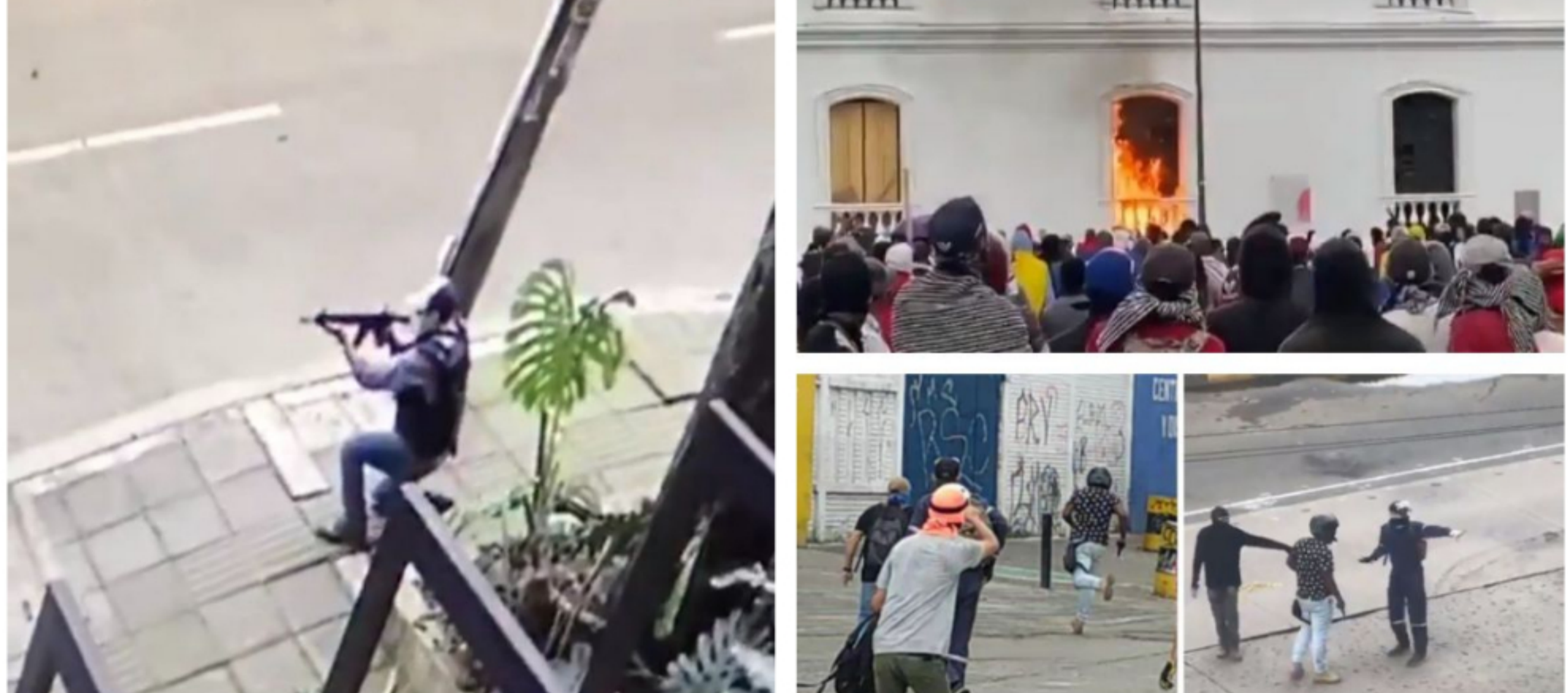
ADEMÁS DE LOS ACTOS REGISTRADOS POR EL GOBIERNO, TAMBIÉN SE HA VISTO A POLICÍAS DE CIVIL DISPARANDO (IZQUIERDA)