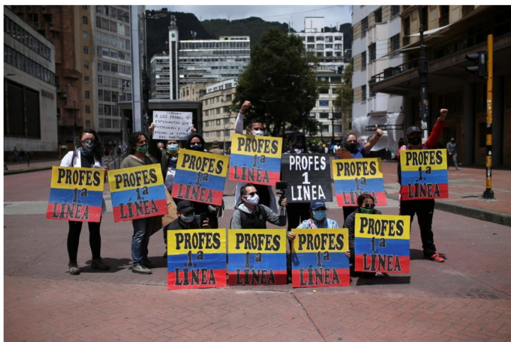
Continúan las manifestaciones exigiendo la acción del gobierno, en Bogotá.

Publicado EL 26 DE MAYO DE 2021 Actualizado EL 26 DE MAYO DE 2021