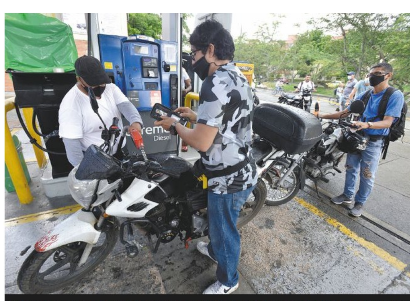
Las estaciones de servicio han dejado de percibir cerca de $340.000 millones, según la ACP.

Los bloqueos en las vías por el paro nacional desnudaron la necesidad de establecer un plan de almacenamiento estratégico de combustibles en el país. Los problemas de suministro de los agentes distribuidores prendieron las alarmas, y las pérdidas en la industria petrolera han sido cuantiosas. Cifras del Gobierno aseguran que los bloqueos han frenado la producción de unos 560.000 barriles de petróleo .