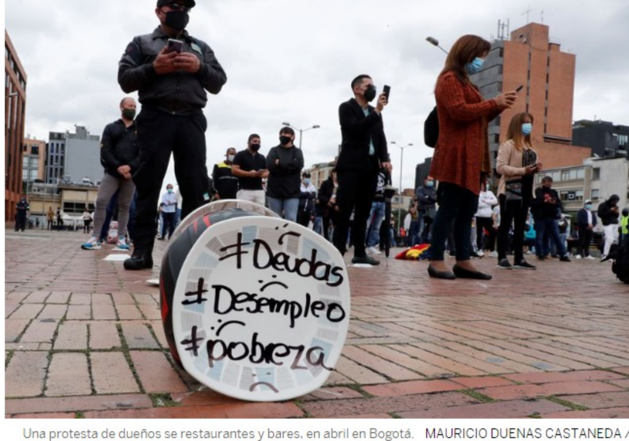
Una protesta de dueños de restaurantes y bares, en abril en Bogotá.

“Si usted sabe a qué se debió el paro, por favor sea pedagogo y explique a todos lo demás que este paro no se debió solamente a la reforma tributaria”, comienza una publicación anónima que se viralizó en redes sociales desde Colombia. Hace más de 20 días el país estalló en protestas y no se ve ahora mismo una salida inmediata. El ministro de Hacienda renunció, la propuesta para subir impuestos fue cancelada y la violencia escaló, mezclándose con el hartazgo de ciudadanos que no quieren solo salir de la pandemia. Quieren, también, entrar a la nueva normalidad con mejores oportunidades de trabajo y calidad de vida.