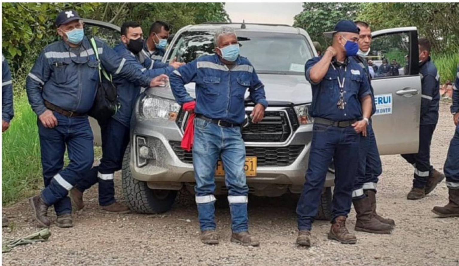
USO denuncia contratos suspendidos en campo de Mansarovar en Puerto Boyacá

Desde el pasado 19 de mayo se viene adelantando protestas por parte de los trabajadores y la comunidad.