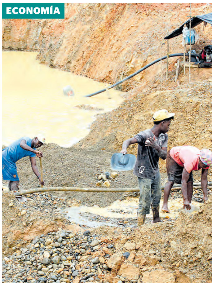
Hay alrededor de 30 toneladas que no se reportan cada año. CEET