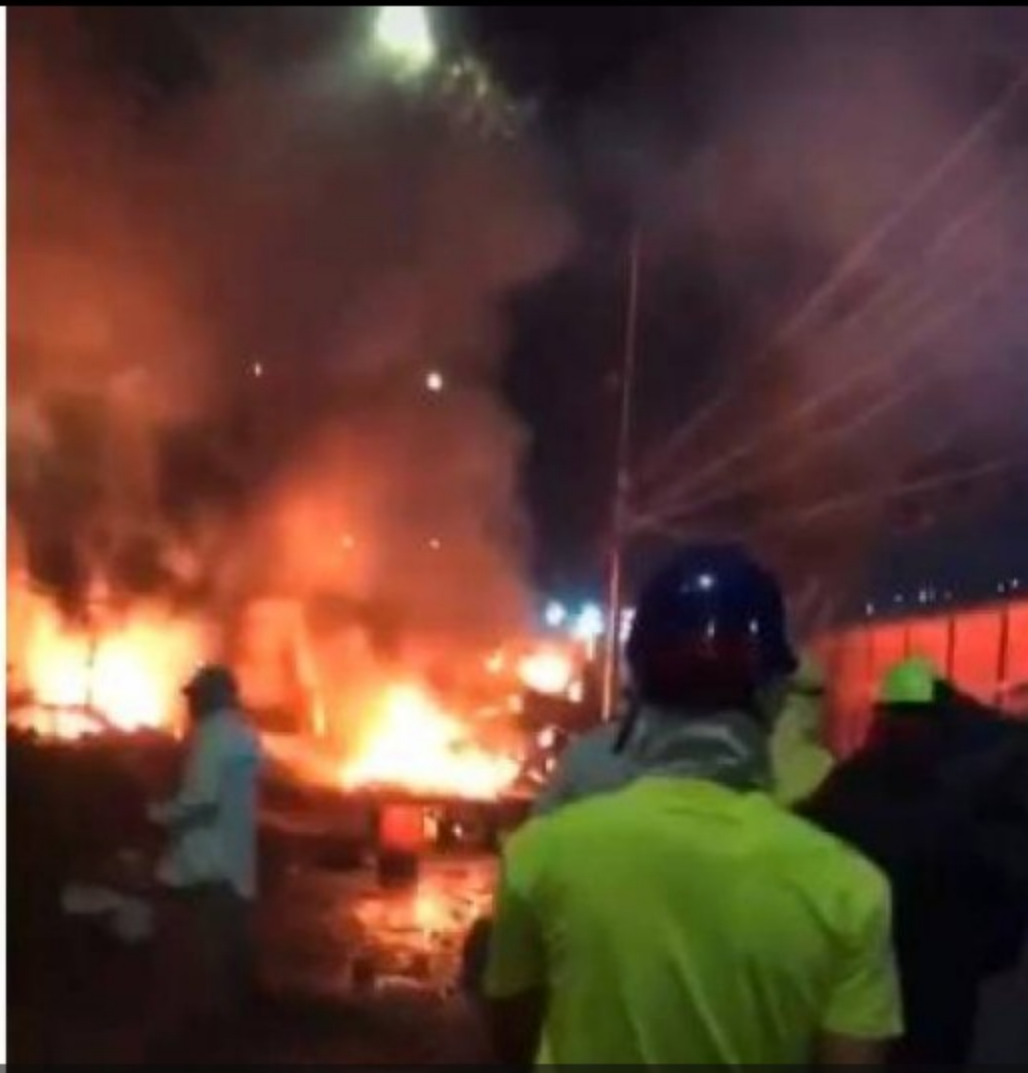
El ministro de Defensa, Diego Molano, reportó que 100 uniformados y un pelotón adicional del Ejército estará en Yumbo para la recuperación del orden público.

El alcalde de Yumbo, Jhon Jairo Santamaría, pidió al Gobierno Nacional que se frenen los enfrentamientos contra manifestantes para que se detengan los problemas de orden público.