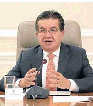
Ministerio de Salud

Fernando Ruiz, ministro de Salud, dijo que se han logrado aplicar cerca de 160.000 vacunas por día.