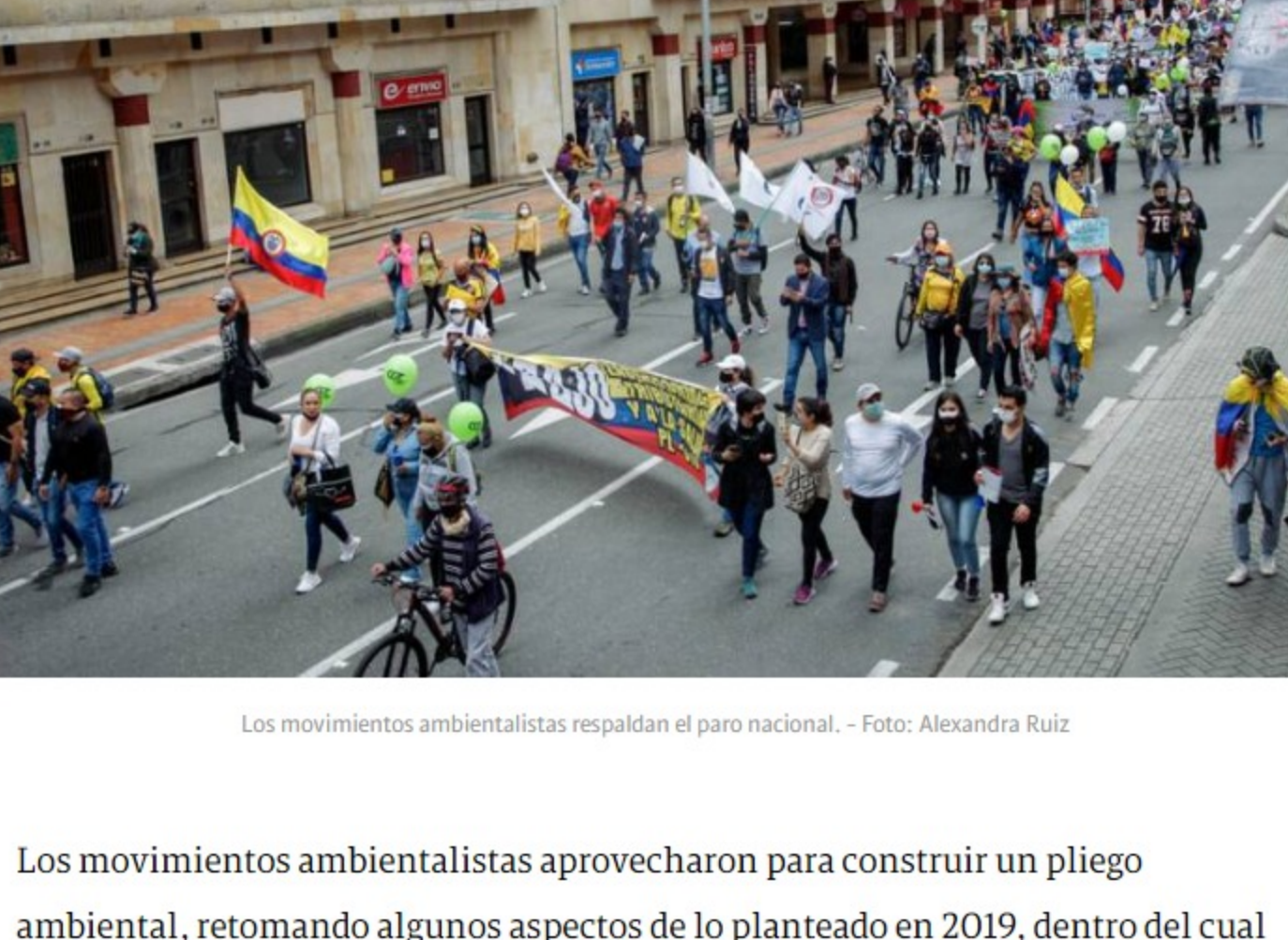
Los movimientos ambientalistas respaldan el paro nacional.

Los ambientalistas ponen sobre la mesa los aprendizajes de la fracasada mesa ambiental de la "Conversación Nacional" del paro del 21N de 2019 y le piden al Gobierno que no continúe imponiendo su visión, ahora a través de lo que ha denominado el "Gran diálogo", con el que se mantiene oídos sordos a los cambios estructurales que millones de colombianas y colombianos reclaman en las calles y en las ruralidades.