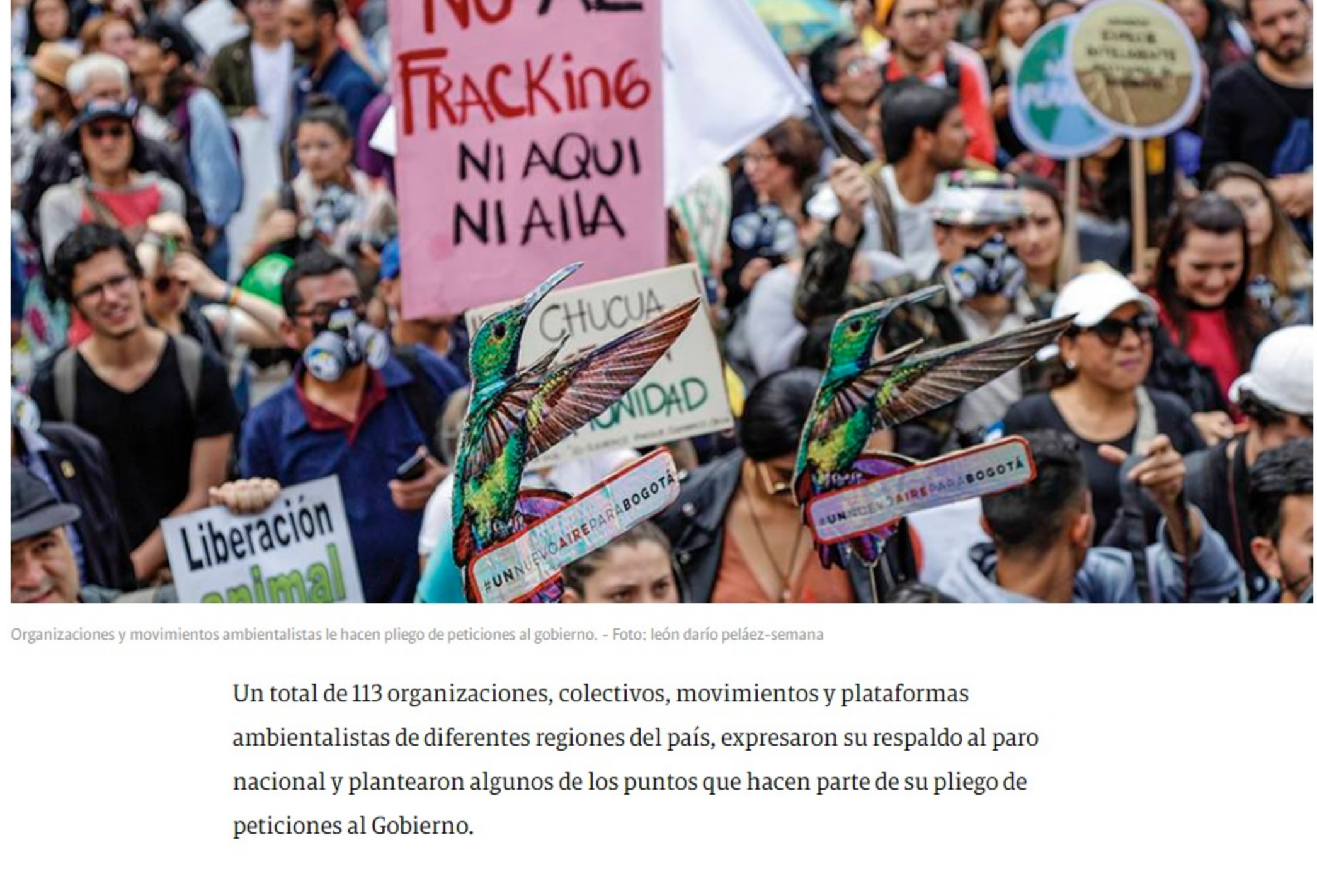
Organizaciones y movimientos ambientalistas le hacen pliego de peticiones al gobierno.

Un total de 113 organizaciones, colectivos, movimientos y plataformas ambientalistas de diferentes regiones del país, expresaron su respaldo al paro nacional y plantearon algunos de los puntos que hacen parte de su pliego de peticiones al Gobierno.