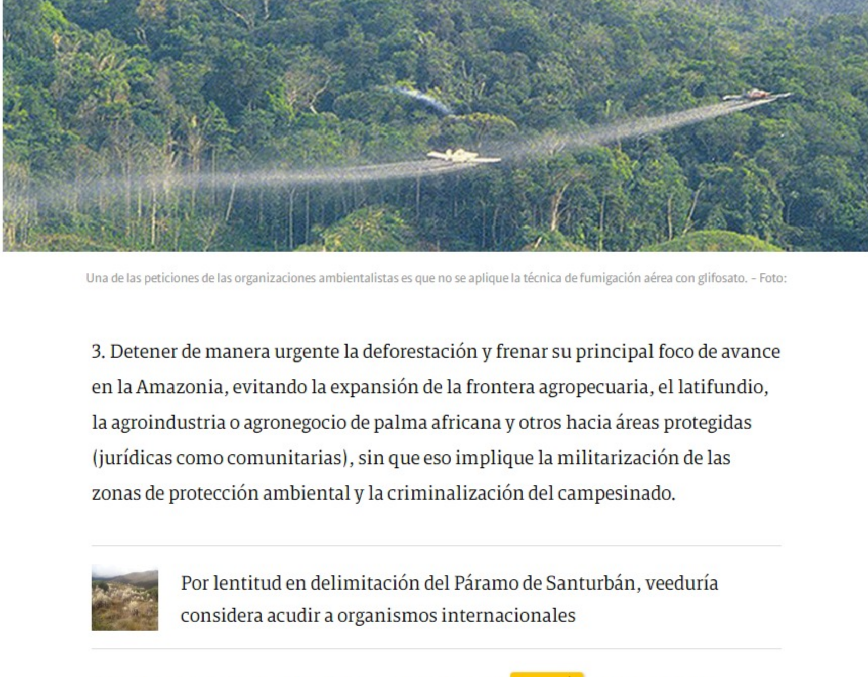
Una de las peticiones de las organizaciones ambientalistas es que no se aplique la técnica de fumigación aérea con glifosato. - Foto:

2. Prohibir la aspersión de glifosato sobre cultivos denominados de uso ilícito, garantizando la implementación de los puntos 1. Reforma Rural Integral y 4. Sustitución de cultivos de uso ilícito del Acuerdo de Paz, que permitan la dignificación de la labor y los proyectos de vida de quienes trabajan la tierra para la seguridad y soberanía alimentaria, a partir de prácticas agroecológicas, protegiendo las semillas como bienes comunes y reconociendo la Declaración de los Derechos de los Campesinos.