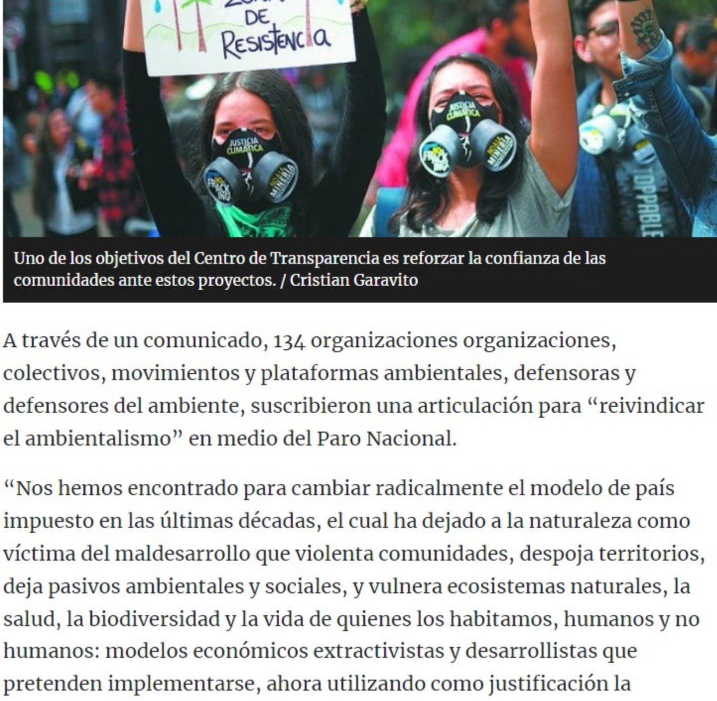
Uno de los objetivos del Centro de Transparencia es reforzar la confianza de las comunidades ante estos proyectos.

A través de un comunicado, 134 organizaciones ambientales, colectivos, movimientos y plataformas ambientales, defensoras y defensores del ambiente, suscribieron una articulación para “reivindicar el ambientalismo” en medio del Paro Nacional.