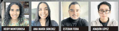
Periodistas de LR que participaron en el Inside LR