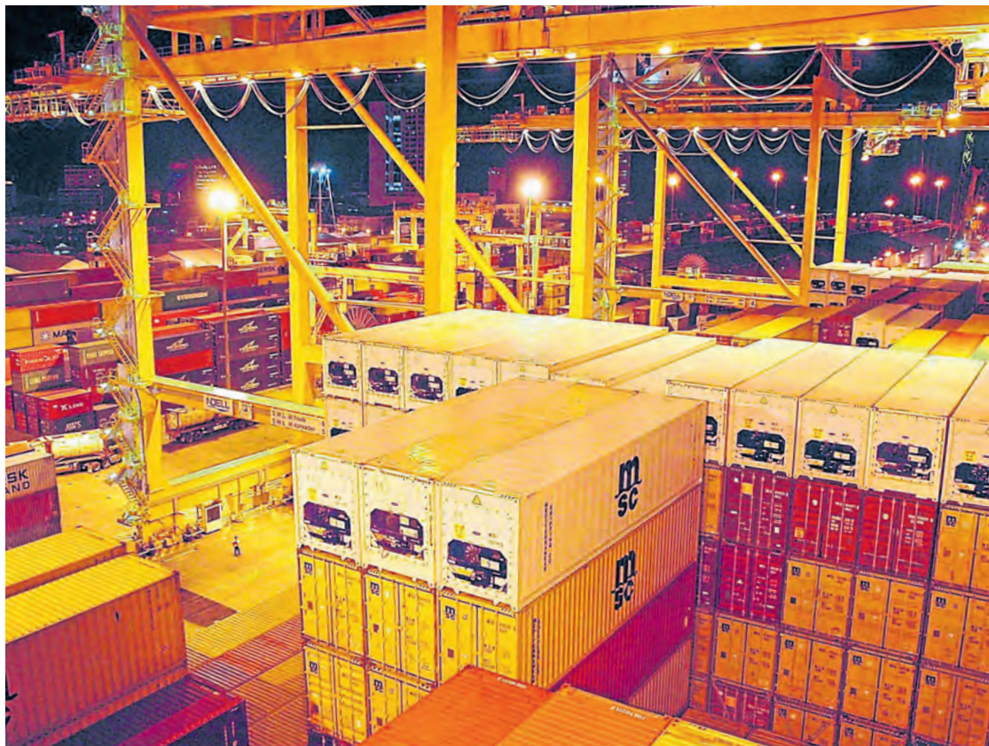
Según la Cámara de Comercio de Buenaventura, el puerto tiene 454.068 toneladas de carga represada.

Según el ministro de Hacienda, José Manuel Restrepo, el valor diario es de $484.000 millones. Los sectores más afectados son comercio, alojamiento, manufactura, transporte, agro y construcción. Ayer las manifestaciones fueron pacíficas, pero continúan los bloqueos. Hay problemas en puertos. Pág. 6