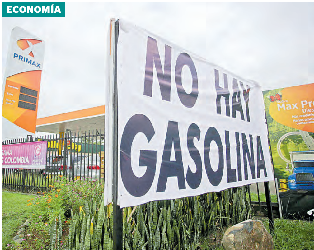
No hubo acuerdo en la primera reunión del presidente Duque con el Comité de Paro. CEET