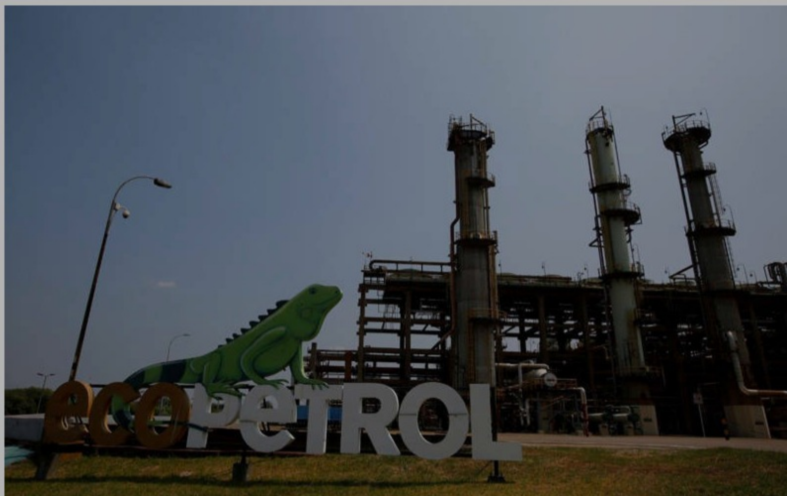
© Reuters Foto der archivo. Vista de la refinería de petróleo de Ecopetrol en Barrancabermeja

BOGOTÁ (Reuters) - La utilidad neta de la petrolera colombiana Ecopetrol subió a 3,08 billones de pesos (808,5 millones de dólares) en el primer trimestre, frente al mismo lapso del año pasado, por el alza de los precios del crudo y los menores costos de operaciones, informó el martes la empresa.