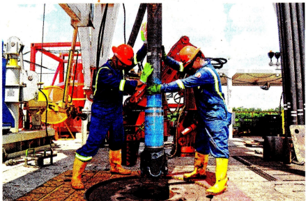
La producción diaria de petróleo de Ecopetrol pasó de 735.000 barriles en el primer trimestre del 2020 a 676.000 barriles en similar periodo del presente año.

“En los siguientes meses del 2021 continuaremos enfocados en el cumplimiento del Plan de Negocio 2021-2023, que busca restablecer la senda de crecimiento de producción, aumentar la competitividad, cimentar la agenda de transición energética y profundizar la SoTeCNbilidad como pilares estratégicos para la generación de valor a la sociedad”, indicó.