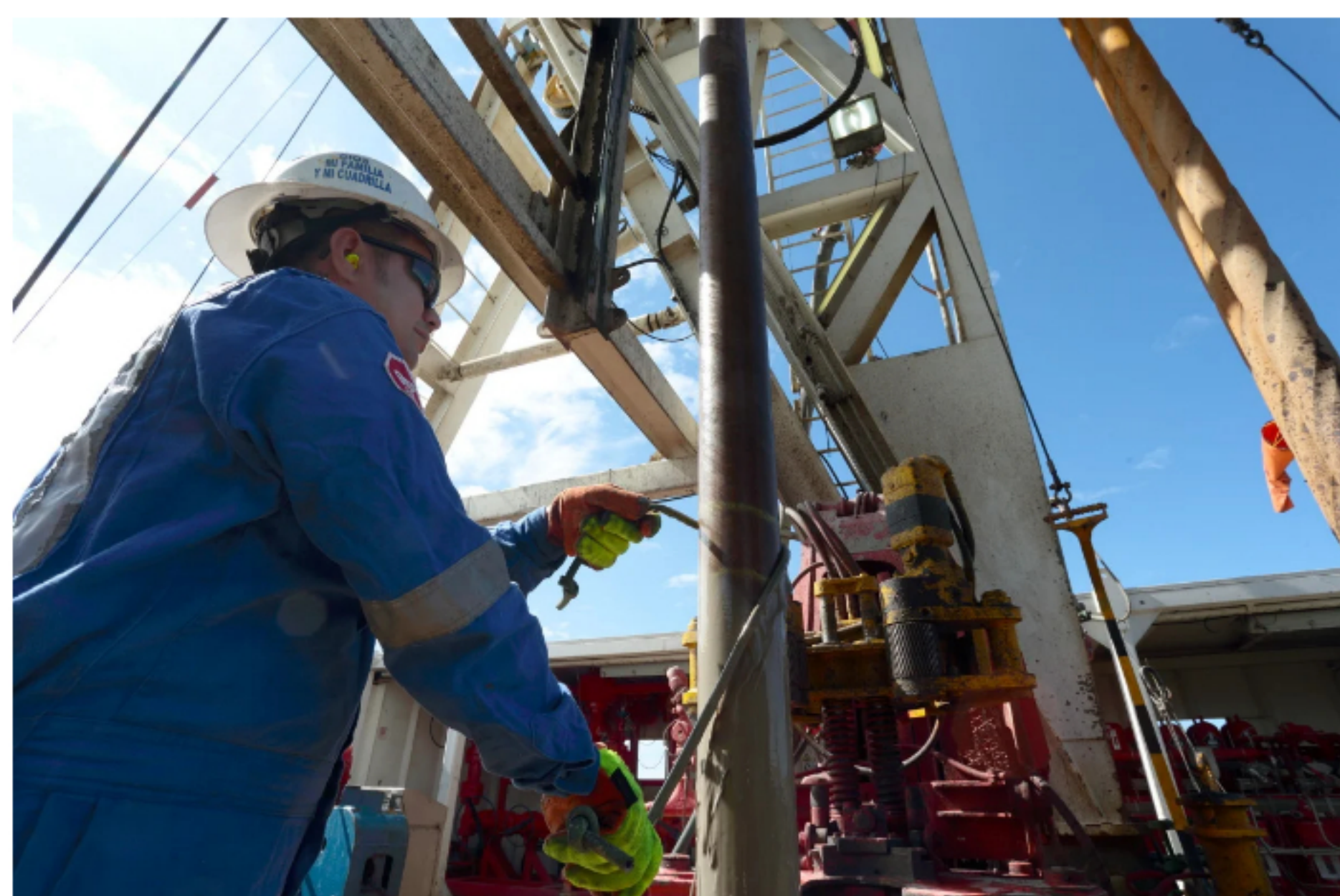
Taladro petróleo.

La petrolera colombiana, Ecopetrol , reportó este martes que obtuvo ganancias por $3,1 billones en el primer trimestre de 2021, su cifra más alta en lo que va de la pandemia, pues en el primer trimestre del año pasado el nivel era cercano a cero. Para más información de petróleo haga clic aquí.