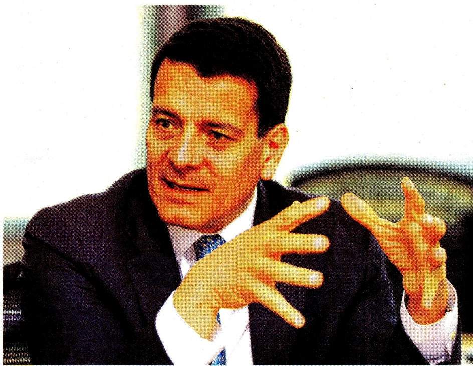
“Los resultados reflejan una recuperación extraordinaria”, Felipe Bayón, presidente Ecopetrol.

“En este escenario se iniciaron operaciones en el 2021 incrementando el número de taladros a un total