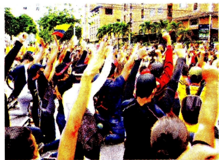
Para hoy están previstas nuevas marchas.