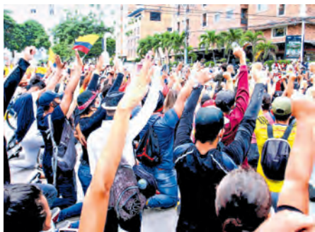
Para hoy están previstas nuevas marchas.