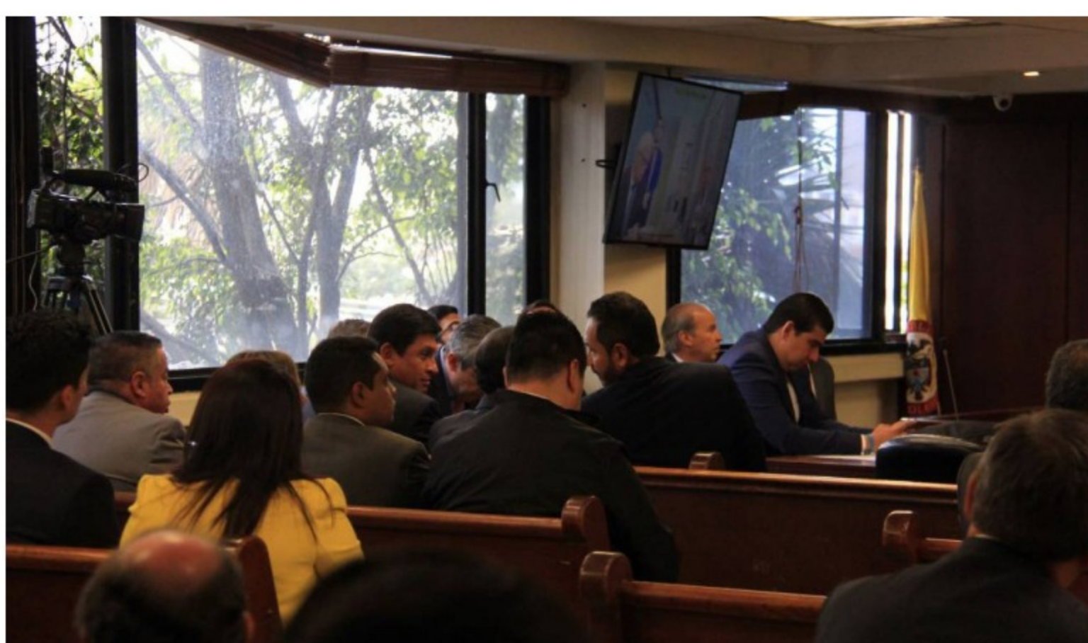
Modernización de la Refinería de Cartagena

Para la Procuraduría, la Junta Directiva de Ecopetrol : "Partió del principio de buena fe y confianza en la capacidad de la administración"