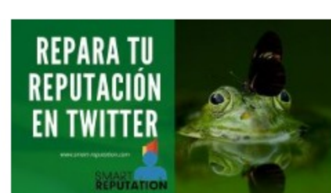
Repara tu reputación en Twitter con Smart Reputation