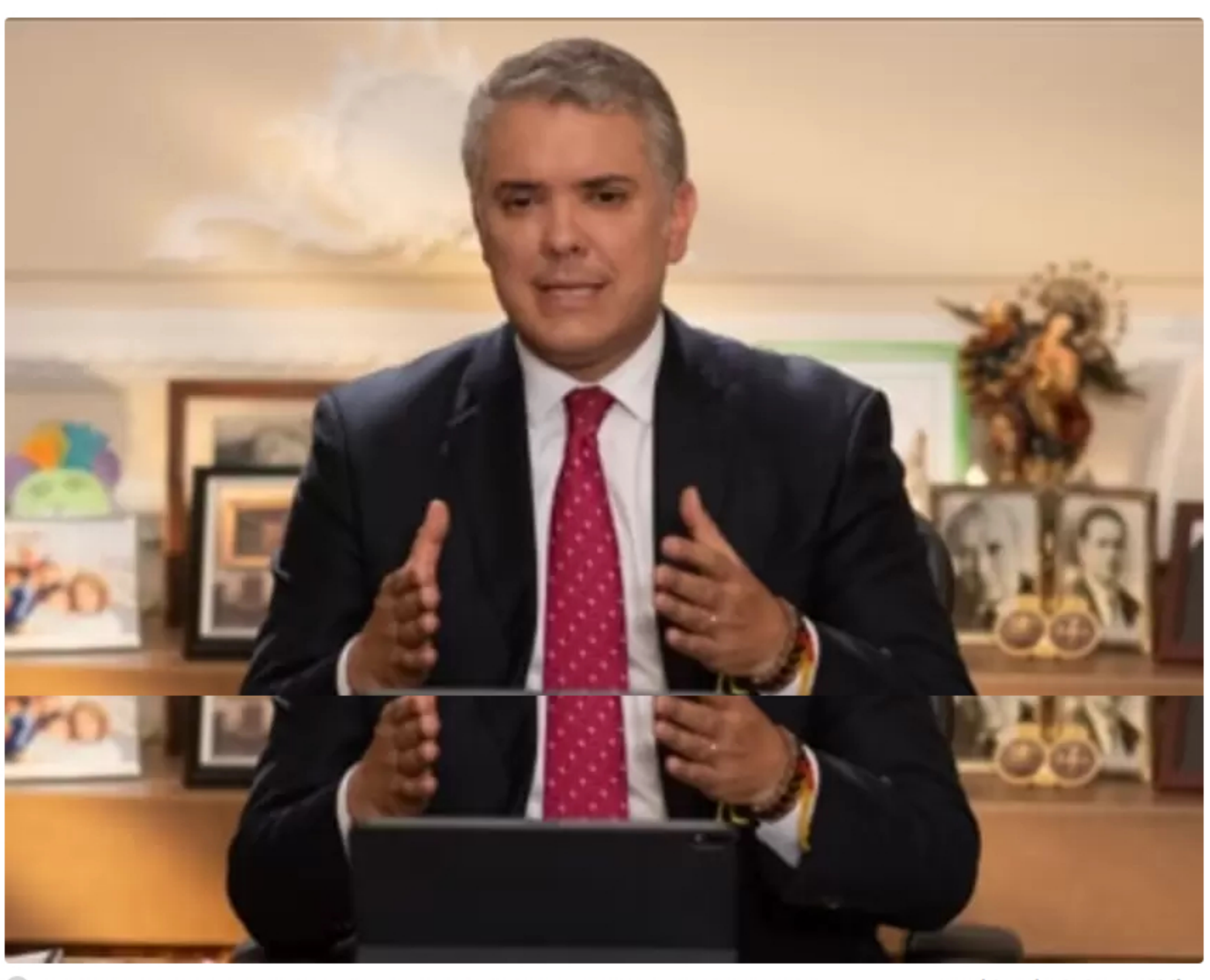
El Gobierno Nacional, a través del Decreto 2087 de noviembre de 2019, dictó medidas para la conservación del orden público.

Con miras a lograr nuevos consensos de cara a la presentación de una nueva reforma tributaria, el Gobierno Nacional buscará reunirse con los presidentes y voceros de todos los partidos políticos.