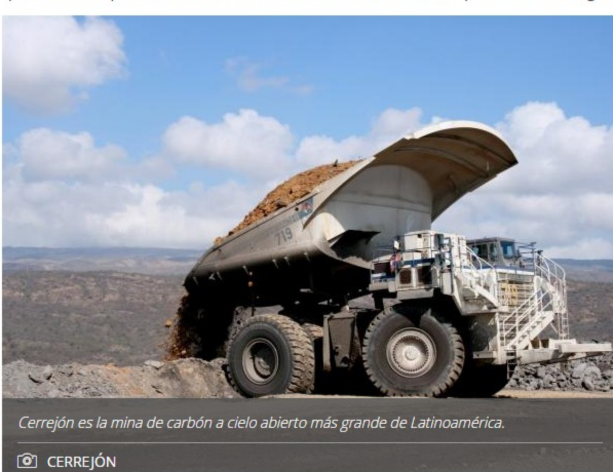
Cerrejón es la mina de carbón a cielo abierto más grande de Latinoamérica.

Con esta transacción, la multinacional suiza hace un negocio redondo, ya que no solo se queda con la mayor parte de la actividad minera del llamado 'cinturón del carbón', que va desde el sur del Cesar hasta La Guajira, sino que también, tiene la operación del ferrocarril de Fenoco (del que es socio con Drummond), línea por la que saca este producto desde las minas en el Cesar hasta el puerto de Ciénaga.