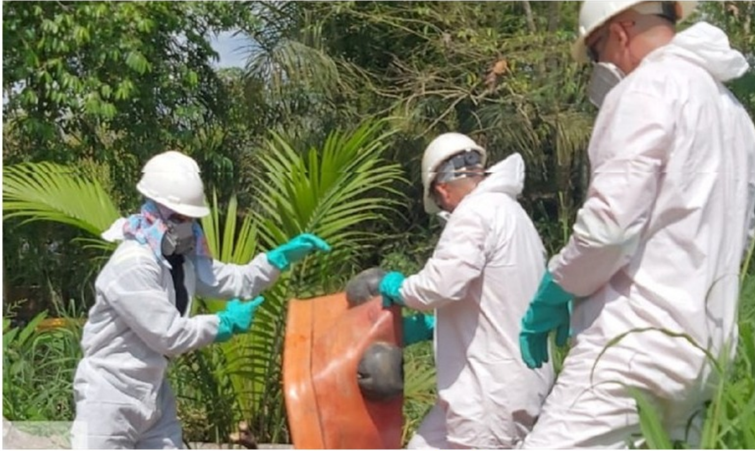
Derrame de crudo .

La empresa encargada de mitigar esta emergencia pide a la comunidad que los dejen ingresar para hacer limpieza de la fuga de hidrocarburos que se originó.