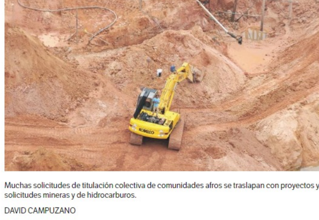
Muchas solicitudes de titulación colectiva de comunidades afros se traslapan con proyectos y solicitudes mineras y de hidrocarburos. DAVID CAMPUZANO

El Proceso de Comunidades Negras y el Observatorio de Territorios Étnicos y Campesinos de la Javeriana han mapeado dónde se ubica cada una de estas solicitudes. Les preocupa que la razón del retraso esté relacionada con que un porcentaje se cruza con futuros y actuales proyectos extractivos.