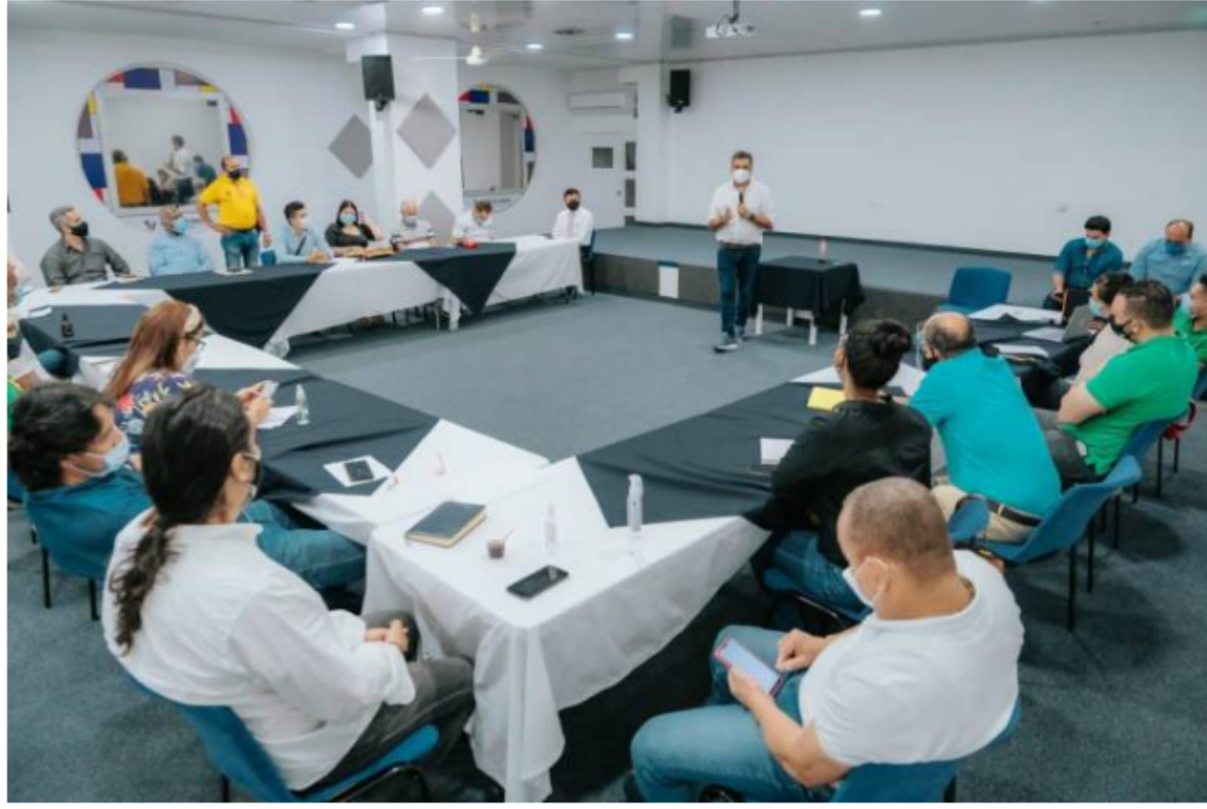
Así es el Pacto por la Vida para frenar contagios y muertes por COVID-19 en Barrancabermeja

Distintos sectores del Distrito Petrolero junto con la Alcaldía se pusieron de acuerdo para hacerle frente a la ocupación UCI que está al 100%.