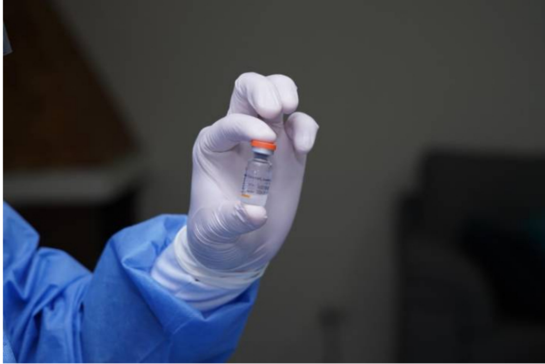
Entregan primeras dosis para vacunación de privados

Este lunes la Asociación Nacional de Empresarios de Colombia Andí recibió de parte del Presidente Iván Duque las primeras 1.5 millones de dosis Sinovac adquiridas para la inmunización de empleados y colaboradores del sector privado.