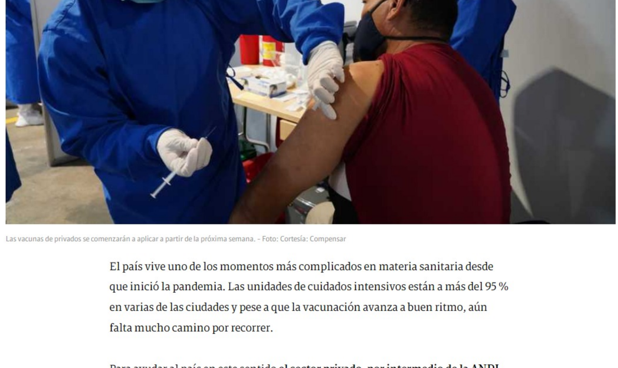
Las vacunas de privados se comenzarán a aplicar a partir de la próxima semana.

El país vive uno de los momentos más complicados en materia sanitaria desde que inició la pandemia. Las unidades de cuidados intensivos están a más del 95 % en varias de las ciudades y pese a que la vacunación avanza a buen ritmo, aún falta mucho camino por recorrer.