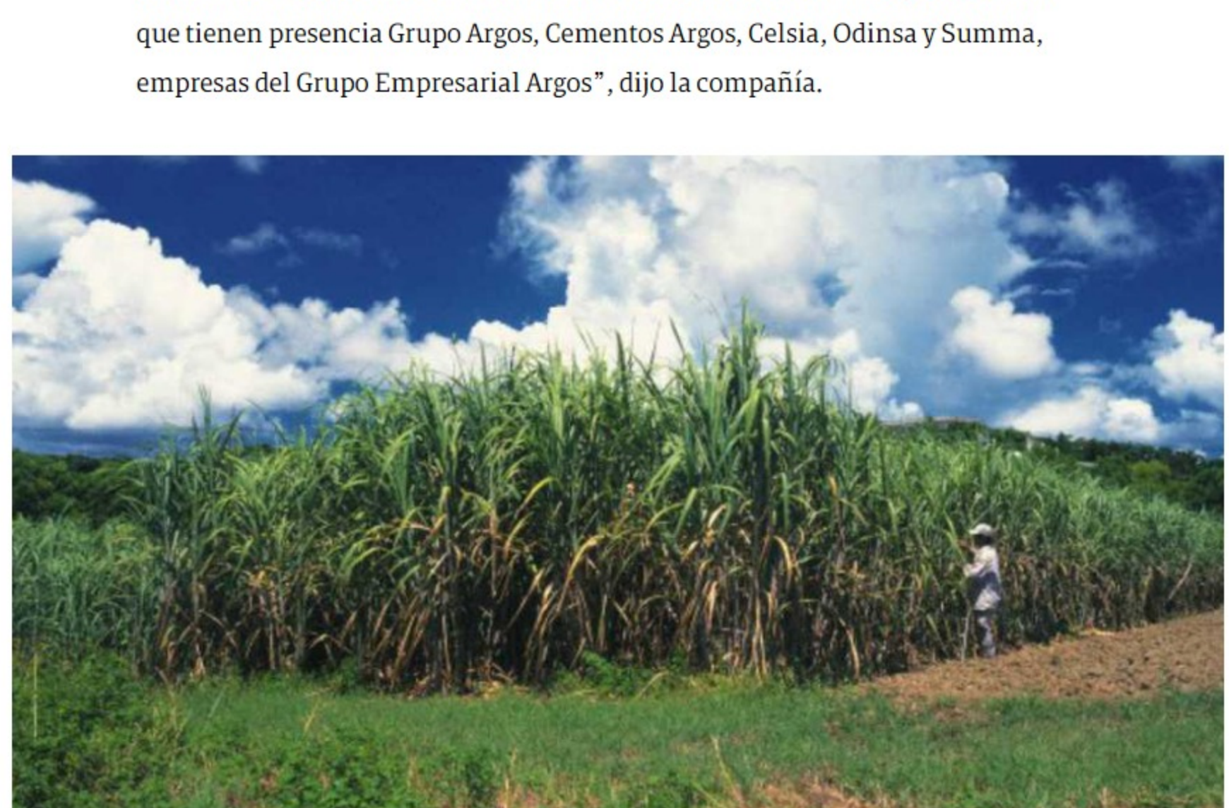
El Grupo Nutresa vacunará a todas las empresas colombianas que forman parte de esta organización. Entre estas se encuentran la Compañía Nacional de Chocolates y otras como Colcafé, El Corral y Zenú.

Así mismo, fuentes le confirmaron a SEMANA que los trabajadores de El Espectador, Noticias Caracol y Blu Radio recibirán las dosis de los lotes pagados por el sector privado.