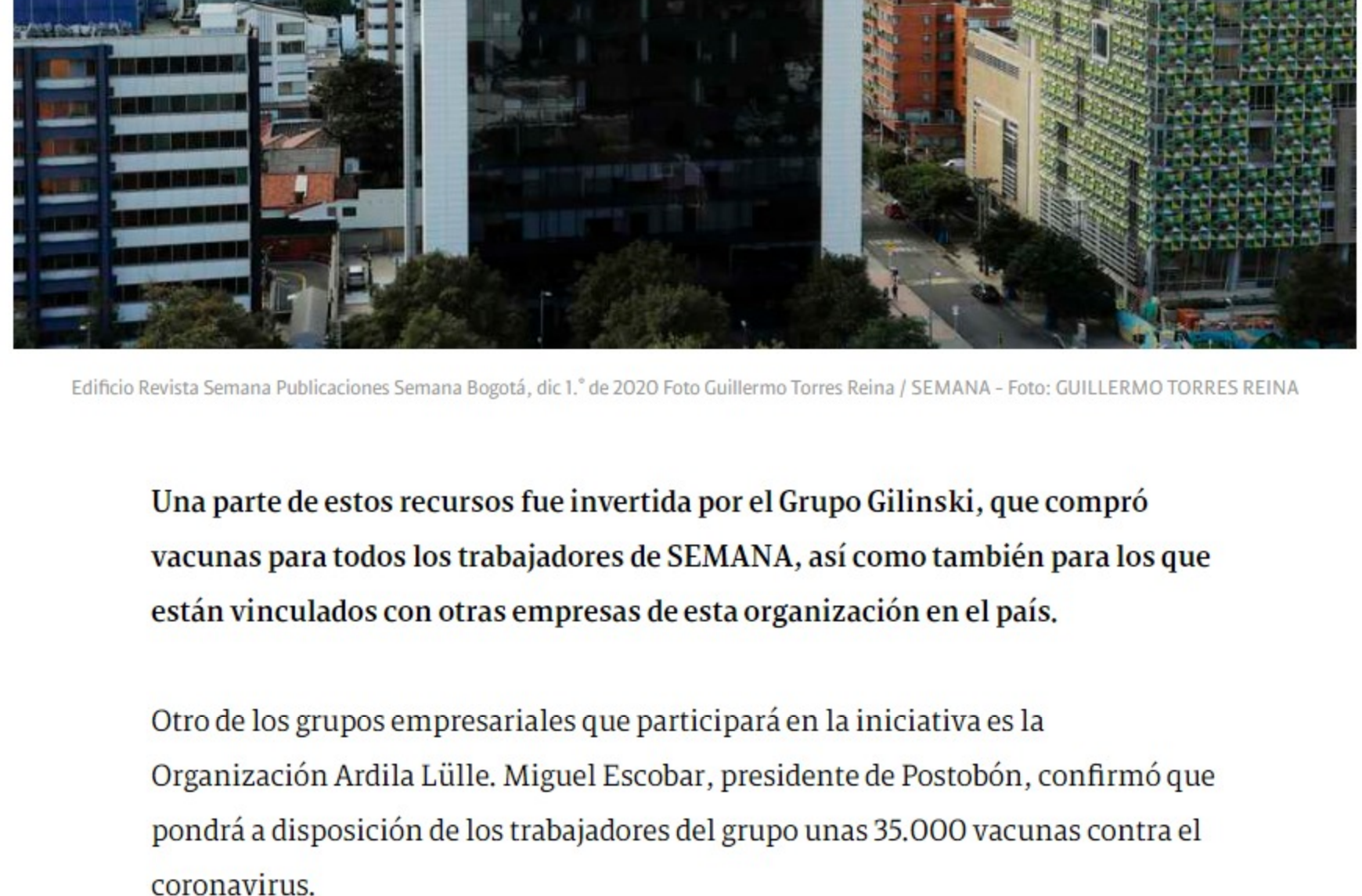
Edificio Revista Semana Publicaciones Semana Bogotá, dic 17 de 2020

La participación del sector privado en esta iniciativa revolucionaria a nivel mundial ha sido bastante exitosa. Mac Master indicó que a las pocas horas de abrir la fiducia donde las empresas debían depositar los recursos se recibieron más de $100.000 millones.