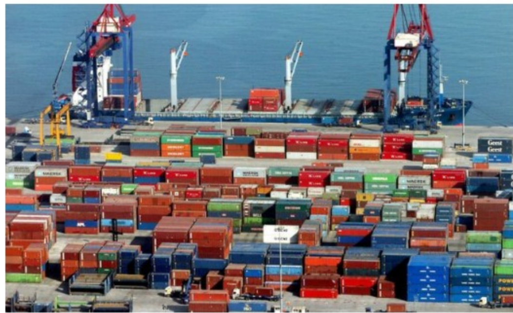
Movimiento de contenedores en puertos.

El Departamento Administrativo Nacional de Estadística (DANE) reveló que durante abril de 2021 las importaciones colombianas registraron un aumento de 51,7 %, pasando de US$3.096 millones en abril de 2020 a US$4.696 millones.