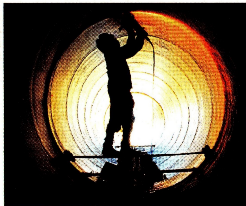
Colombia se destaca por sus condiciones geológicas.

Además, agrega que Colombia tiene potencial geológico pero para que se desarrolle es necesario impulsar el crecimiento de su demanda.