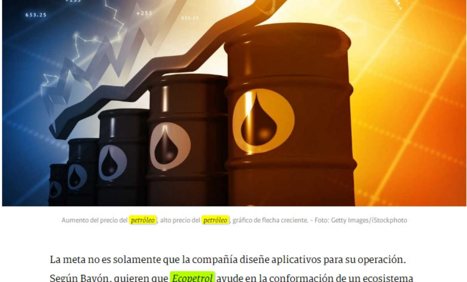
Aumento del precio del petróleo , alto precio del petróleo , gráfico de flecha creciente.

De hecho, uno de los casos destacados es el diseño de bots (programas informáticos que, de manera automática, realizan tareas repetitivas en internet mediante una cadena de comandos o funciones autónomas), que hoy resuelven muchos asuntos bot de la operación diaria. "Hace un poco más de tres años no teníamos ningún bot en Ecopetrol . El primer bot se llamó Boco, que apareció en marzo de 2018, y nos ayuda a hacer los cálculos para los beneficios de los empleados, en particular el tema educativo. Hoy tenemos más de 120 bots trabajando en el grupo, que son útiles en temas de inversión, cronogramas, cuentas por pagar y por cobrar. Ellos se han vuelto parte de la vida", contó Bayón.