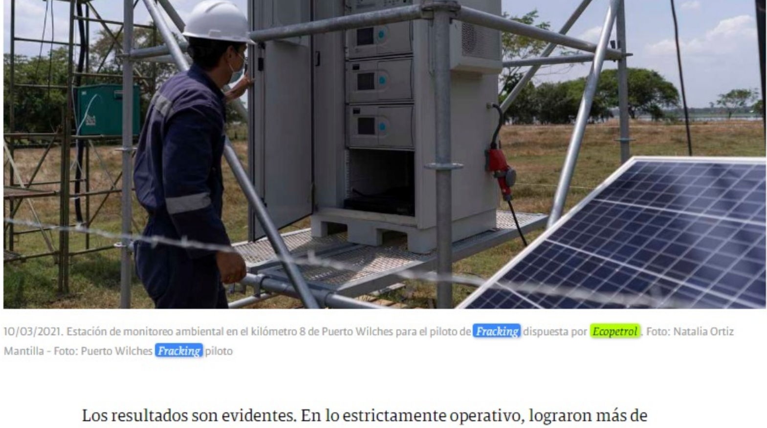
10/03/2021. Estación de monitoreo ambiental en el kilómetro 8 de Puerto Wilches para el piloto de Fracking dispuesta por Ecopetrol . Foto: Natalia Ortiz Mantilla - Foto: Puerto Wilches Fracking piloto

"Ese es un proceso que lleva más tiempo, varios años, y que nos permitió la transformación digital. Pudimos, por ejemplo, irnos a trabajar de manera remota en marzo, antes de los simulacros de aislamiento en Bogotá. Tuvimos muy pronto al 85 por ciento de nuestra planta trabajando de manera remota. Así mismo, movimos muchos procesos a la nube. En total, hicimos una inversión entre innovación y tecnología cercana a los 120 millones de dólares", comentó.