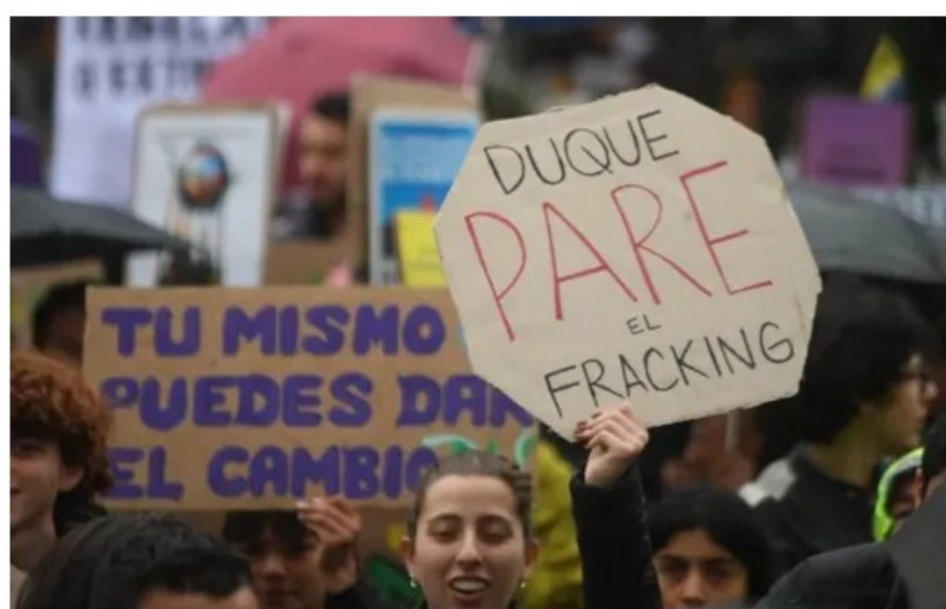
El objetivo principal de Escazú es garantizar el acceso a la información ambiental, la participación pública en la toma de decisiones ambientales y el acceso a la justicia en este mismo campo.